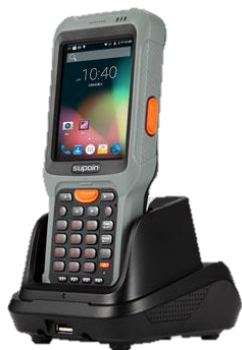
クレードル (別売品)

ハンディターミナル端末NSC-S50は、大画面タッチパネルを搭載。WiFiやBluetoothの無線通信機能を搭載。保護等級IP65に準拠した高い防塵、防水性能を備えており、地面（コンクリート上2.5m）からの衝撃耐性を持っております。