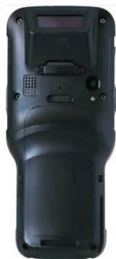
付属品・オプション品