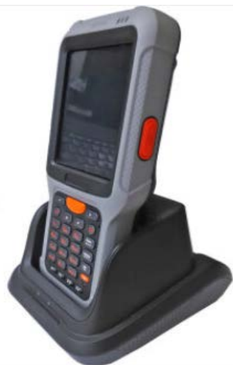
クールドル (別売品)